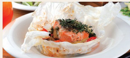
サーモンと季節野菜のパピヨット(包み蒸し) ~地中海風~ Papillon w/Salmon & Seasonal Vegetables ※パンorライスからお選びください