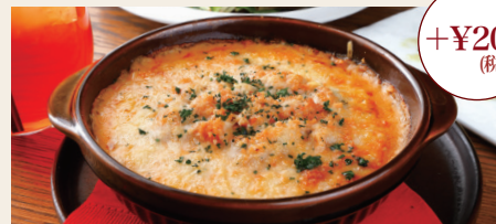
【数量限定】雲丹ドリア Sea Urchin Doria +200 (Limited)