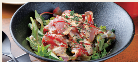
サーロインのローストビーフ丼 ~燻製ハラペーニョソース~ Roast Beef Rice Bowl