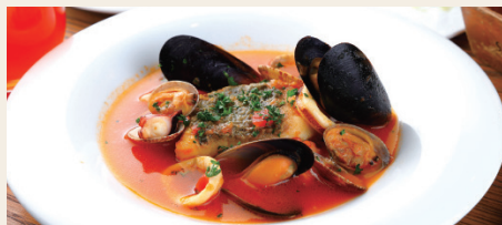
まだい 熊本県産真鯛のブイヤベース ~シェリー酒の香り~ Bouillabaisse of Sea Bream w/Sherry ※パンorライスからお選びください