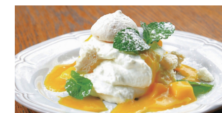
アップルマンゴーのクレマダンジュ ~ふわっと軽いレアチーズムースに、 マンゴーの爽やかな甘み特徴~