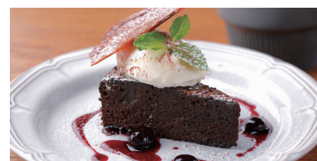
クラシックガトーショコラ ~口どけの良い、ほどよい甘さの チョコレートケーキ~