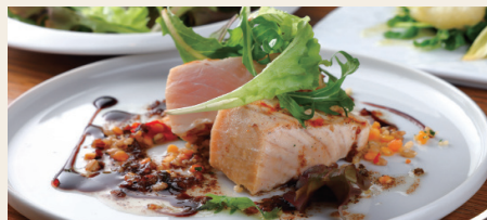
メカジキのグリル レンズ豆ともち麦のタブレ ~ブルノワゼット(焦がしバターソース)~ Grilled Swordfish ※パンorライスからお選びください