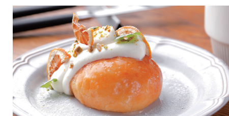
レモンのババ・オ・ラム ~芳醇なラム酒がたっぷり染み込んだ、 大人のプリオッシュケーキ~