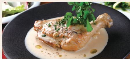
骨付き鶏モモ肉のクリーム煮 ~ブランケットドブルーレ~ Blanquette of Chicken Thigh ※パンorライスからお選びください