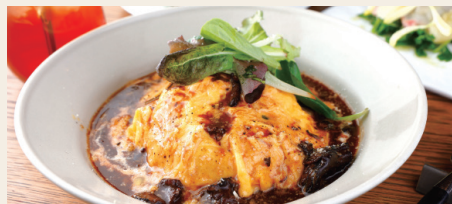
米沢牛デミグラスソースのオムライス ~グリエールチーズとバターライス~ Yonezawa Beef Omelet Rice w/Demi-Glace Sauce