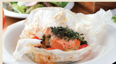
サーモンと季節野菜のパピヨット(包み蒸し) ~地中海風~ Papillon w/Salmon & Seasonal Vegetables ※パンorライスからお選びください