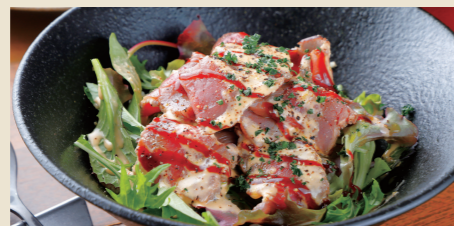
サーロインのローストビーフ丼 ~燻製ハラペーニョソース~ Roast Beef Rice Bowl