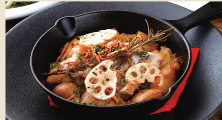
山形県産天元豚ロースのグリル ~粒マスタードのブーランジェール風~ Grilled Yamagata Tengen Pork Loin