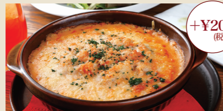
【数量限定】雲丹ドリア Sea Urchin Doria +200 (Limited)