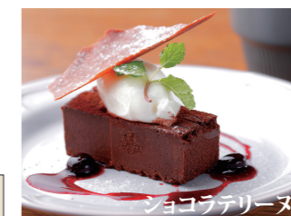
ショコラテリーヌ