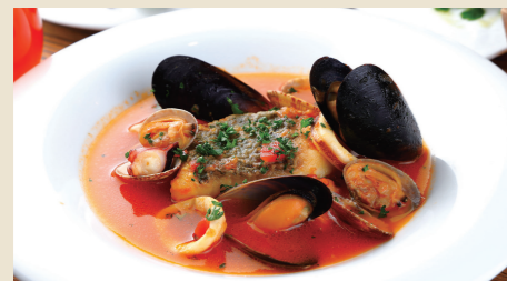
熊本県産真鯛のブイヤベース ~シェリー酒の香り~ Bouillabaisse of Sea Bream w/Sherry ※パンorライスからお選びください