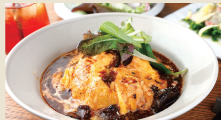
米沢牛のデミグラスソースのオムライス ~グリエールチーズとバターライス~ Yonezawa Beef Omelet Rice w/Demi-Glace Sauce