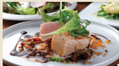
メカジキのグリル レンズ豆ともち麦のタブレ ~ブルノワゼット~ Grilled Swordfish ※パンorライスからお選びください