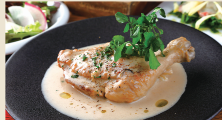
骨付き鶏モモ肉のクリーム煮 ~ブランケットドプーレ~ Blanquette of Chicken Thigh